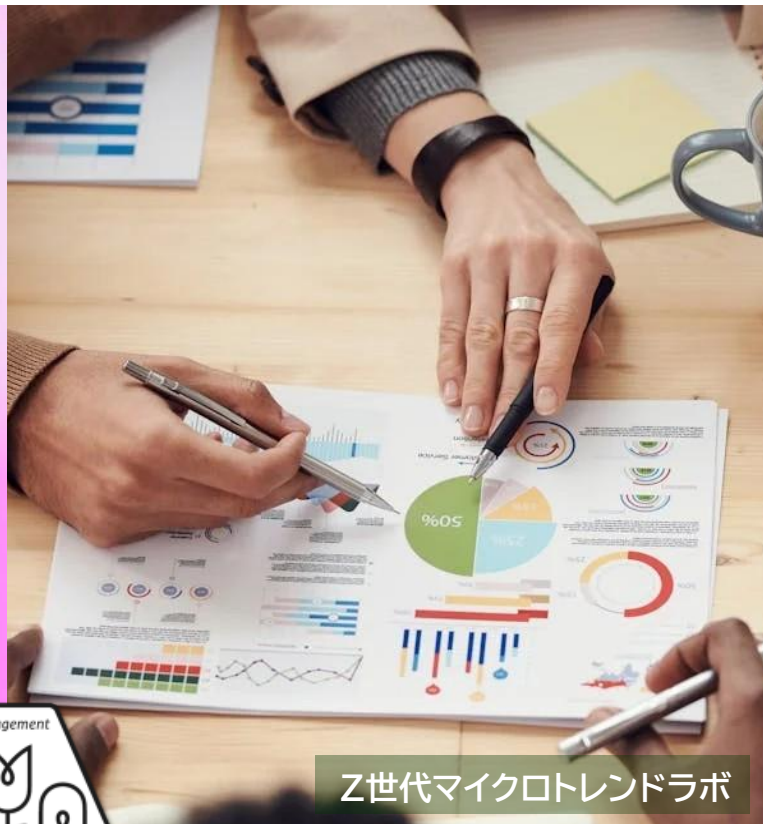
Z世代マイクロトレンドラボ