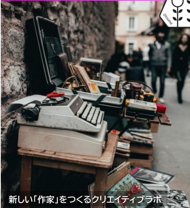
新しい「作家」をつくるクリエイティブラボ