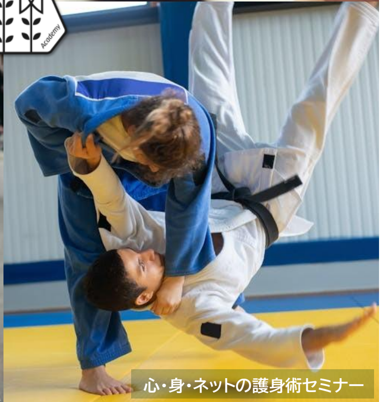
心・身・ネットの護身術セミナー