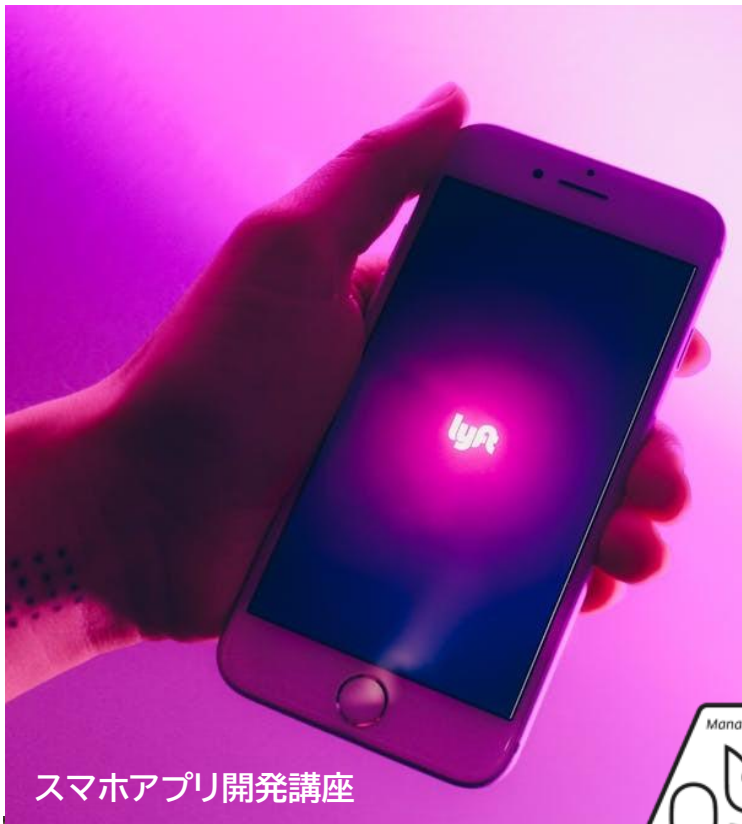
スマホアプリ開発講座